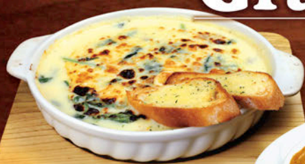
チキンとほうれん草

マカロニたっぷりのグラタンと、ラザーニエとソースが折り重なるラザニア。どちらもグルービーで作るソースが決め手!! アツアツをお召し上がりください。