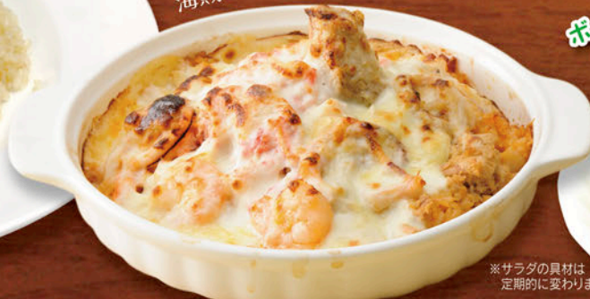
ボリュームたっぷり アンティサラダ付き!