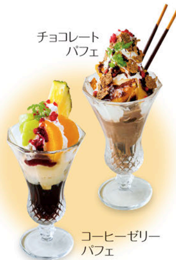
コーヒーゼリー パフェ