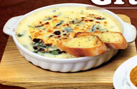
チキンとほうれん草

マカロニたっぷりのグラタンと、ラザーニエとソースが折り重なるラザニア。どちらもグルービーで作るソースが決め手!! アツアツをお召し上がりください。