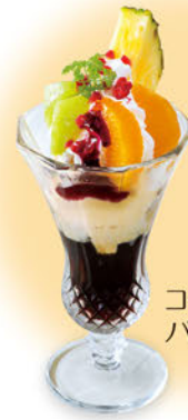
チョコレート パフェ