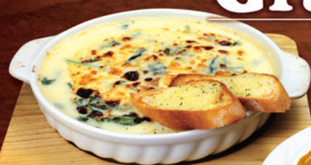
チキンとほうれん草

マカロニたっぷりのグラタンと、ラザーニエとソースが折り重なるラザニア。どちらもグルービーで作るソースが決め手!! アツアツをお召し上がりください。