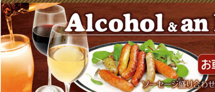
ソーセージ盛り合わせ