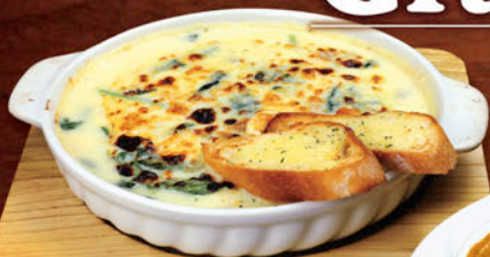
チキンとほうれん草

マカロニたっぷりのグラタンと、ラザーニェとソースが折り重なるラザニア。どちらもグルービーで作るソースが決め手!! アツアツをお召し上がりください。