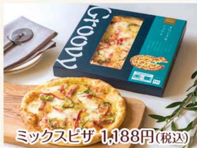
ミックスピザ 1,188円(税込)