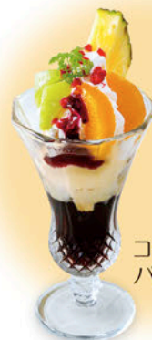
チョコレート パフェ