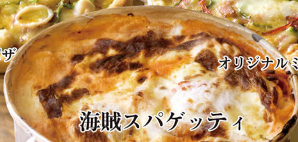
海賊スパゲッティ