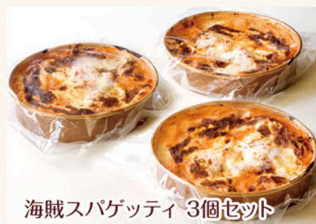
海賊スパゲッティ 3個セット