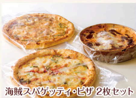
海賊スパゲッティ・ピザ 2枚セット