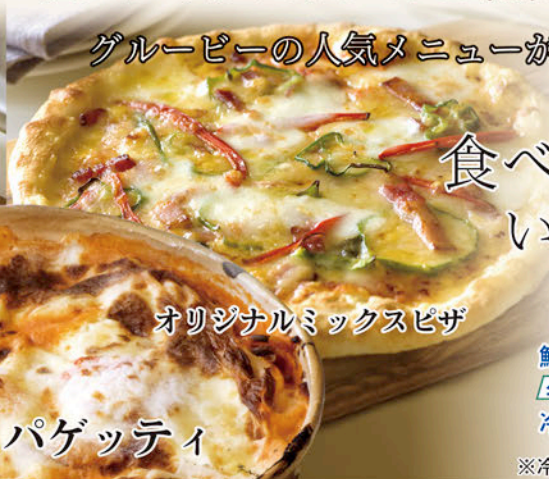
オリジナルミックスピザ