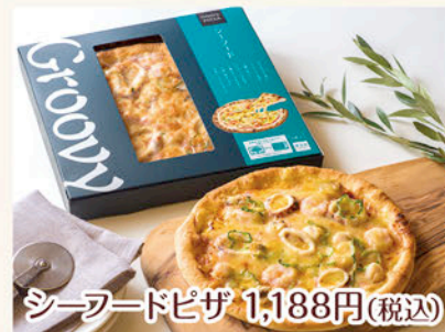
シーフードピザ 1,188円(税込)