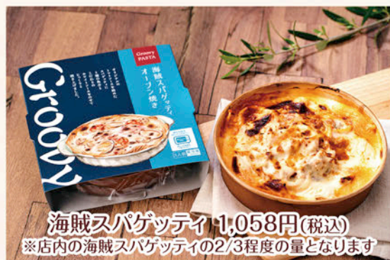
海賊スパゲッティ 1,058円(税込)