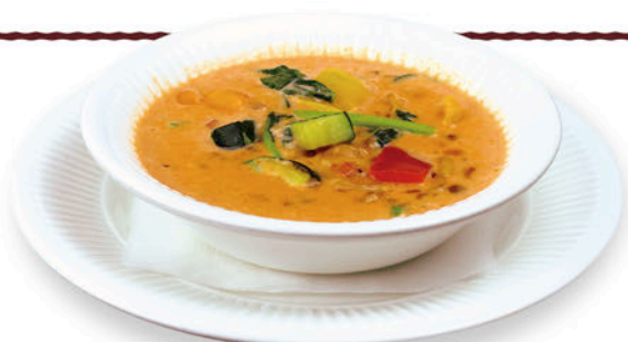
本日のスープ ※店舗・季節によって内容は異なります